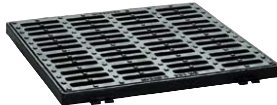
▲ Art. Nr. 323 Einlaufgitter quadratisch aus Sphäroguss